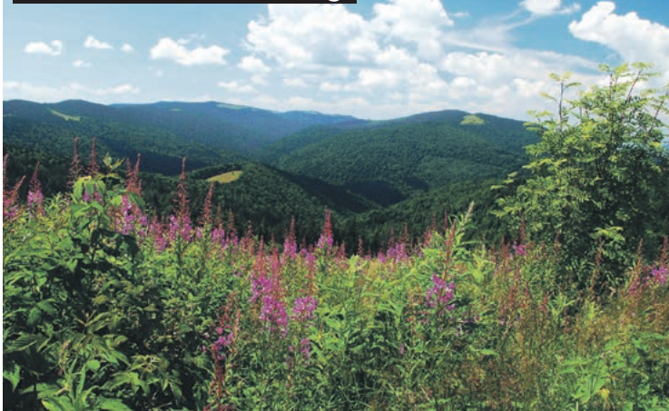
Widok z Gorca Kamienickiego

Łagodne grzbiety i atrakcyjne widokowo polany zachęcają do wycieczek po Gorcach. Stosunkowo niewielka wysokość szczytów nad poziom można nie zwalnia nas z przygotowania do górskiej wycieczki. Przed każdą wędrówką należy sprawdzić pogodę, która w górach bywa zmienna oraz zaplanować trasę wycieczki uwzględniając swoje możliwości. Poruszając się po parku narodowym stosujemy zasady odpowiedzialnej turystyki „leave no trace” (nie zostawiaj śladu), co oznacza poszanowanie zasad obowiązujących na danym terenie, tak aby nasza obecność nie wpływała negatywnie na gorceńską przyrodę. Na szlakach turystycznych i ścieżkach edukacyjnych zamontowane są urządzenia infrastruktury technicznej, które zapobiegają erozji szlaków lub ułatwiają wędrówkę w zabagnionych miejscach. Stop-