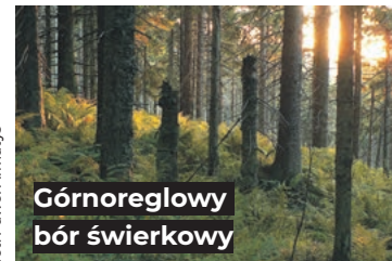
Górnoreglowy bór świerkowy