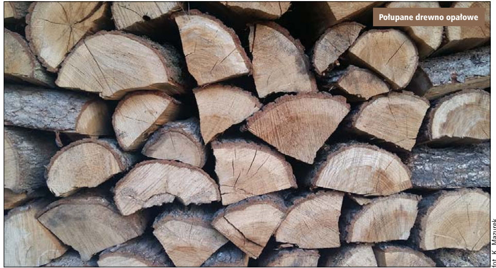
Potupane drewno opałowe

Ceny różnicowane są w zależności od gatunku drewna. Przykładowo za 1m 3 sosny S4 (czyli opałowego) zapłacimy 129,60 zł,