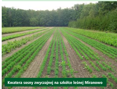
Kwaterna sosny zwyczajnej na szkółce leśnej Miranowo

▼ Hodowla lasu zajmuje się utrzymaniem lasów już istniejących oraz zalesianiem terenów dotychczas pozbawionych roślinności leśnej. Nieodzownym etapem hodowli jest konieczność zbioru nasion drzew leśnych, ich odpowiednie przechowanie, siew i produkcja w specjalnych miejscach, zwanych szkółkami leśnymi. Wyprodukowane w szkółce sadzonki są wykorzystywane przy wymienionych wcześniej odnowieniach czy zalesieniach. Następnie przez dziesięciolecia są pielęgnowane zgodnie ze sztuką leśną.