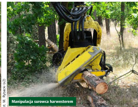
Manipulacja surowca harvesterem