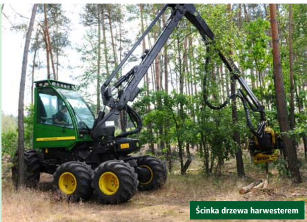
Ścinka drzewa harvesterem

lasu to działalność związana z korzystaniem z zasobów lasu. Leśnicy na podstawie decyzji ministra mają za zadanie pozyskiwać dary lasu – drewno oraz umożliwiać społeczeństwu wypoczynek na łonie natury oraz korzystanie z dobrodziejstw lasu, takich jak owoce leśne (maliny, jeżyny, poziomki) i grzyby.