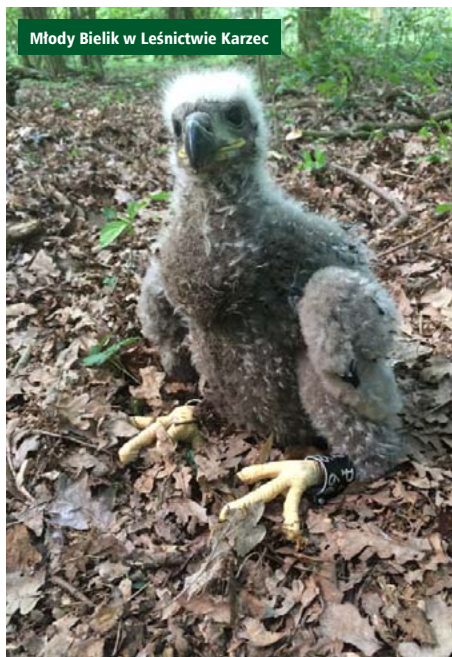
Młody Bielek w Leśnictwie Karzec

▲ Ochrona przyrody to dla wszystkich pracowników lasów prowadzenie racjonalnej i proekologicznej gospodarki leśnej każdego dnia. To troska o szczególnie cenne obszary takie jak np.: obszary Natura 2000, rezerваты przyrody, pomniki przyrody.